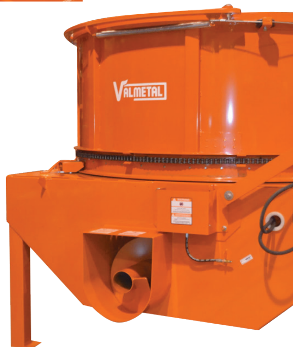
Garde enlevé pour montrer les détails.