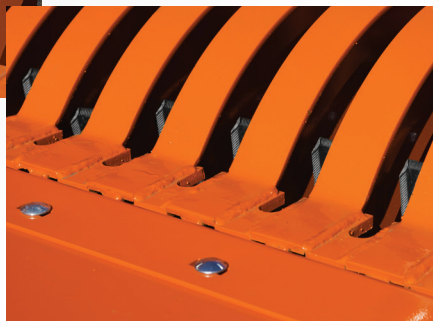
Grille extra fine

Une extension conique est disponible en option afin d'éviter le débordement de la cuve lors du remplissage avec de longues balles rectangulaires.